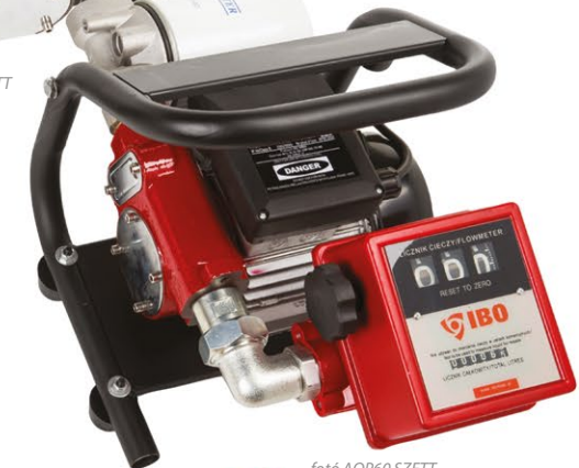
fotó AOP60 SZETT

Az AOP szivattyúk elmozdítólápatos szivattyúk, amelyeket dízel, fűtőolaj és biodízel szivattyúzására terveztek. A szivattyúk motor tekercsbe épített hővédelemmel vannak felszerelve.