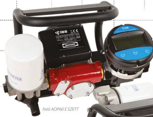
fotó AOP60 E SZETT